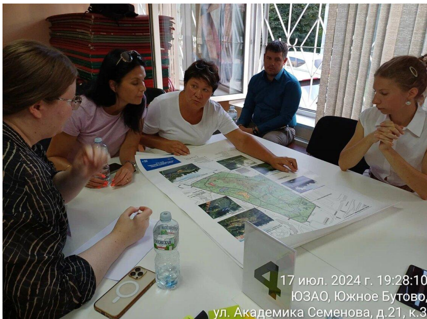
17 июл. 2024 г. 19:28:10 ЮЗАО, Южное Бутово, ул. Академика Семенова, д.21, к.3